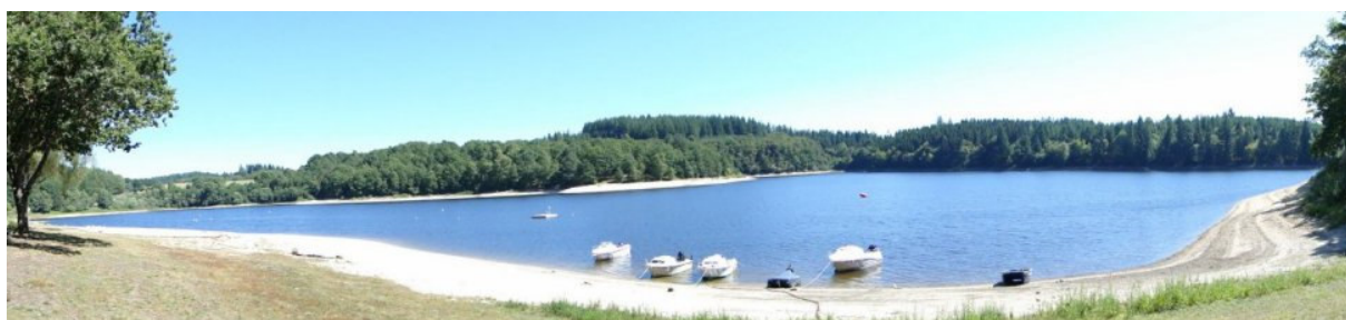
Le lac de VIAM

Une semaine de cyclotourisme et de balades !